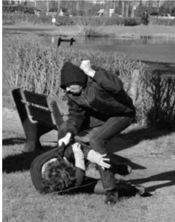
Extreem-rechts geweld in Uitgeest, februari 2007

Met enige regelmaat ontvangt het Bureau Discriminatiezaken meldingen over extreem-rechtse uitingen. Dat varieert van websites en -forums waar mensen flink over de schreef gaan tot flirts met nazistisch gedachtegoed. In 2005 voerde het BD in de Zaanstreek een quickscan uit naar het voorkomen van ultrarechts. In overleg met de gemeente Zaanstad is vorig jaar een aanvang gemaakt met een langlopend, diepgaand onderzoek naar rechts-radicalisme in de Zaanstreek. Daarbij wordt gesproken met 'ervaringsdeskundigen' en professionals, literatuuronderzoek verricht en het internet afgezocht op extremisme. Het BD hoopt voor de zomervakantie van 2009 een rapport te kunnen presenteren waarin de resultaten staan van al dit spoorwerk. Meer informatie? Bel (075-6125696) of mail ( info@bdzaanstreek.nl ).