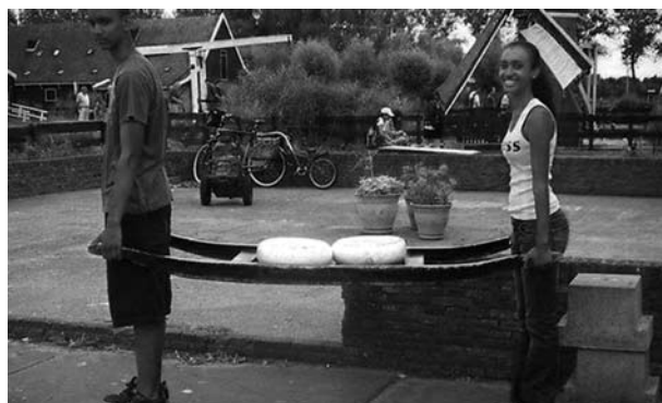
'Op de Zaanse Schans', een van de geëxposeerde foto's.

Bezoekers zijn dan ook welkom met vragen over discriminatie, integratie en aanverwante thema's. Ze kunnen op de Gedempte Gracht ook terecht met klachten over ongelijke behandeling. En er worden in maart enkele malen themabijeenkomsten gehouden. Voor de laatste informatie: zie www.bureaudiscriminatiezaken.nl . De twee BD-paviljoens zijn gedurende de hele maand maart dagelijks tussen 10.00 en 16.00 uur geopend, van dinsdag t/m zaterdag.