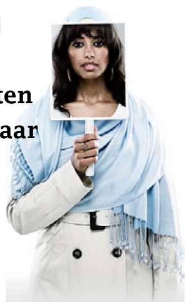
Landelijke campagne 'Moet jij jezelf thuislaten als je naar buiten gaat?'

Moet jij jezelf thuislaten als je naar buiten gaat?